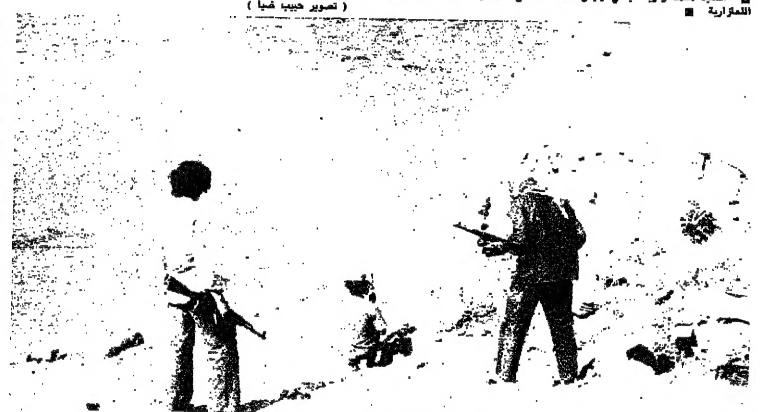
مسلحون يتركزون على الشاطئ في عين المرسة